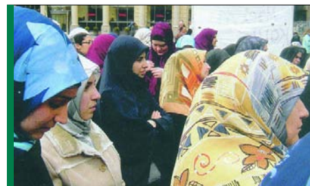
Übertretung in Sachsen? Nicht mit der NPD!

„Als Ausländerbeauf- tragter werde ich mich nicht als Vertreter der Ausländerlob- by im Landtag verstehen, sondern dafür Sorge tragen, daß die Zahl der dauerhaft im Freistaat lebenden Auslän- der gering bleibt, indem durch entsprechende Pro- gramme die in Sachsen woh- nenden Ausländer beraten und ihnen die Möglichkei- ten zu einer Heimkehr in Würde aufgezeigt werden.“