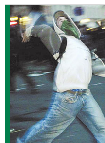
Randalen – meist von links

Die NPD forderte im Sächsischen Landtag unverzüglich Aufklärung über die Vorfälle – es war immerhin bereits die zweite mit Gewaltexzessen verbundene Demonstration von Linksextremen in Pirna