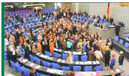
Bundestagsplenium – bald nur noch Vollzugsorgan Brüssels?

Es geht dabei um die Arbeit der sogenannten „Föderalismuskommission“, die sich seit mehr als einem Jahr mit einem Umbau der